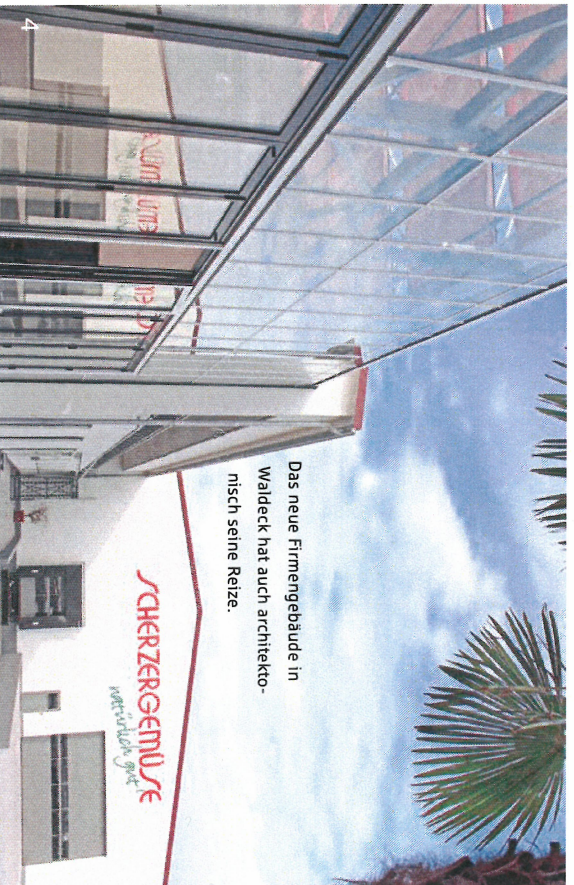
Das neue Firmengebäude in Waldeck hat auch architektonisch seine Reize.

Unter den Glasdächern in Waldeck reifen ausschließlich Tomaten heran. 150 000 Pflanzen liefern pro Jahr rund 2000 Tonnen der roten Früchte in konstant bester Qualität. Man hat den Eindruck, die Pflanzen fühlen sich hier sehr wohl. Im unteren Teil sind die Stauden gebündelt und dabei so geführt,